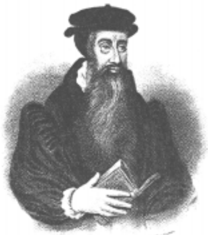
John Knox (1515-72)

en uitvoer van 'n aborsie? Nee, omdat dit los staan van die ingreep kan hulle dit nie weier nie. As christen-verpleegkundige met gewetensbeswaar oor aborsie, is jy steeds daarvan oortuig dat die pasiënt, al ondergaan sy 'n aborsie, steeds sorg nodig het. Juis in hierdie versorging is die christen-verpleegster nodig. Sy moet egter duidelik wees: met die voorbereiding en uitvoer van aborsie wil sy niks te make hê nie. Dit gee die uitgangspunt van liefdevolle bewoë versorging, maar dit is duidelik prinsipiëel bepaal.